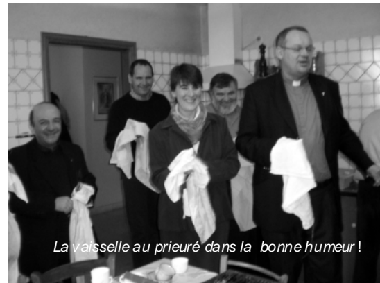
La vaisselle au prieuré dans la bonne humeur !