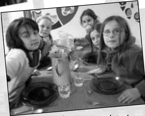
La communauté de saint Paul de la Croix (passionistes) nous a accueilli et hébergés.