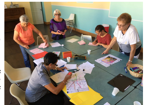
Répartition des secteurs à visiter