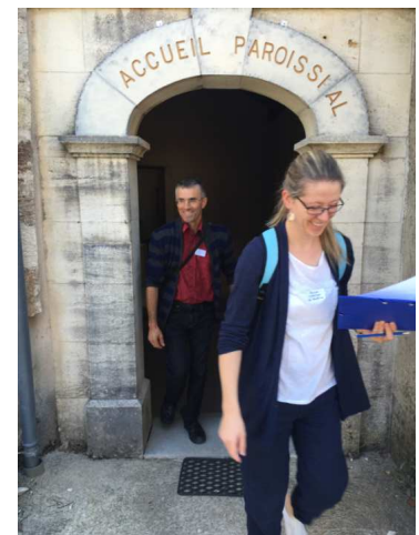
C'est parti !