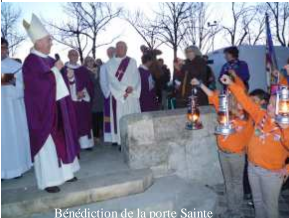
Bénédictio de la porte Sainte

La lumière de Bethléem d'abord : il s'agit d'une flamme qui vient de Bethléem et qui est symbole de paix, elle est fragile et elle éclaire. Cette flamme est accueillie par les scouts de France qui la portent aux divers coins de l'hexagone.