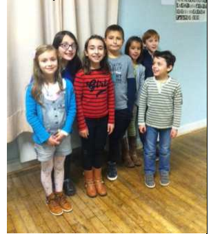
Groupe de Marthon