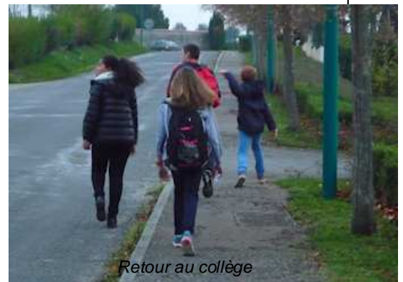
Retour au collège