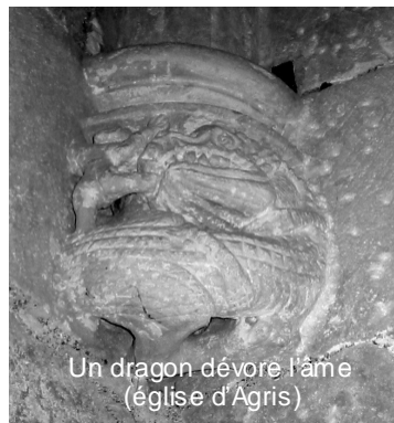
Un dragon dévore l'âme (église d'Agris)