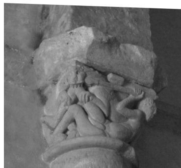
Combat entre un lion et un homme. L'homme se défend, il ne sera pas dévoré (église de La Rochette)