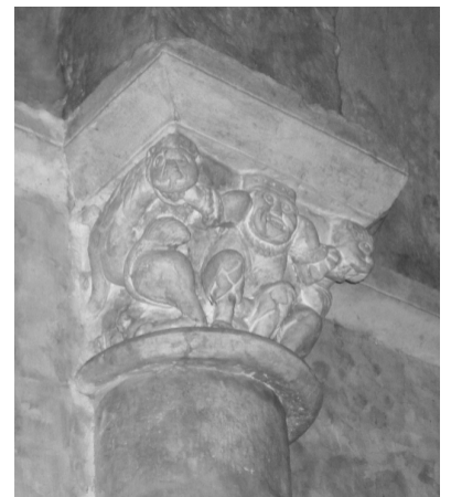
homme contre deux lions.