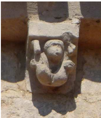
Modillon mur sud de l'église de Montbron

Souvent, c'est notre propre animalité qui est victorieuse. Les représentations de cette victoire sont volontairement effrayantes (le fauve dévore la petite créature), pour bien marquer les esprits des réels dangers que nous encourons. Les Pères de l'Église disaient déjà, que les passions sont plus dangereuses pour l'âme que ne l'étaient pour les corps, les tigres et les lions dans les arènes.