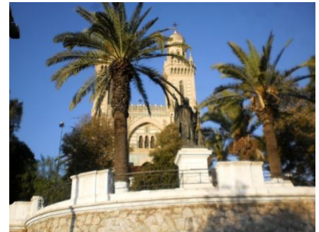
Basilique Saint Augustin Annaba (Hippone), en Algérie

Samedi 31 mai à l'Église de Massignac, à 20h30.