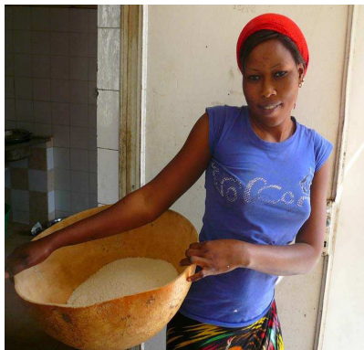
Une calabasse de mil (1€) nourrit une famille pour une journée.

Dans le cadre du carême, nous pouvons venir en aide aux paroissiens. Pour vous encourager à faire un don, voici quelques repères simples : 1 sac de 100 kilos de mil = 35 € (nourrit une famille pendant un mois) 1 tine de 20 kilos de mil = 7 € (nourrit une famille pendant une semaine) la calabasse du jour = 1 € (nourrit une famille pour une journée) Une collecte sera faite à l'issue des messes des Rameaux en ce sens. Vous pouvez aussi faire un don dans une enveloppe en indiquant « Du mil pour Dydir ».