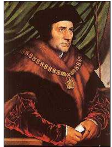
Saint Thomas More (1477-1535) Patron des responsables de gouvernement et des hommes politiques

Paris, le 3 octobre 2011, Le conseil permanent de la Conférence des évêques de France