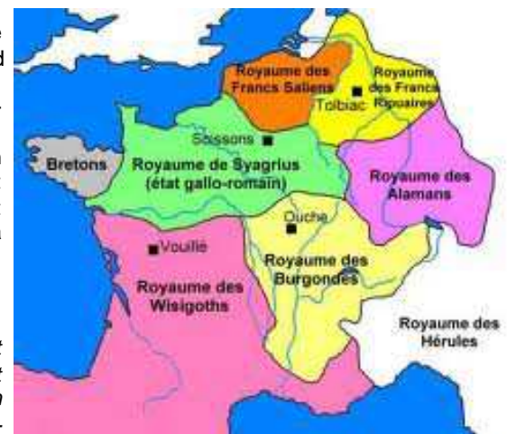
La Gaule à l'avènement de Clovis