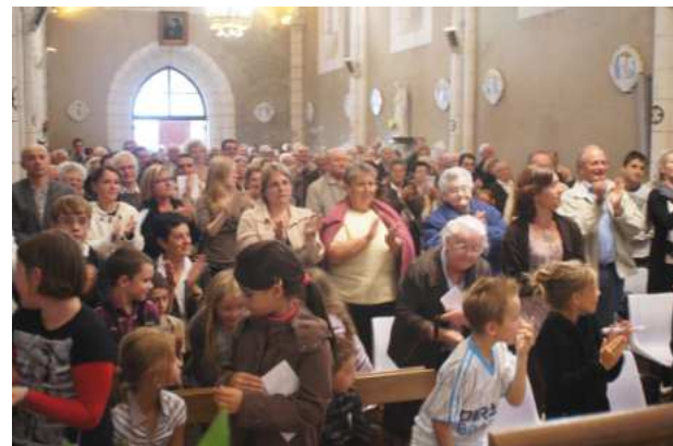
L'ovation de l'assemblée à la fin de la cérémonie.

« J'ai de la peine qu'il s'en aille ; vraiment ! » ( paroissienne de 90 ans )