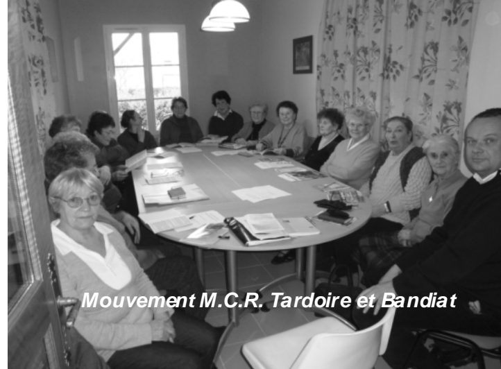
Mouvement M.C.R. Tardoire et Bandiat

Nous avons terminé par une question pratique sur la revue. Quel est votre avis sur le nouvel essor ? Un accord a été donné à l'unanimité d'augmenter la revue campagne d'année avec éventuellement 1€ de plus pour aider financièrement le mouvement et remplacer le nouvel essor.