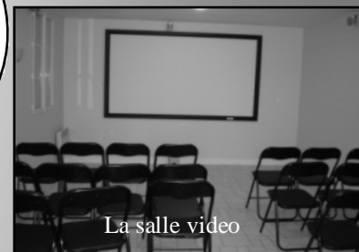
La salle video