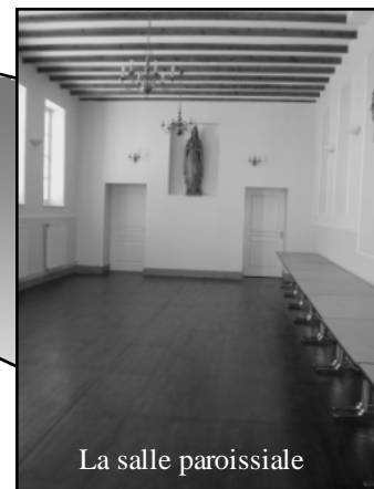
La salle paroissiale