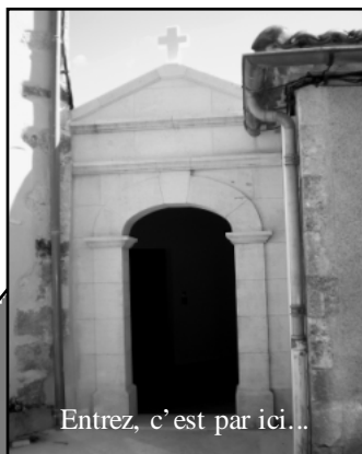
Entrez, c'est par ici...

Pour ceux qui, portés par la foule de ce jour mémorable, ont traversé le prieuré sans rien voir, nous vous offrons ce petit tour du propriétaire: