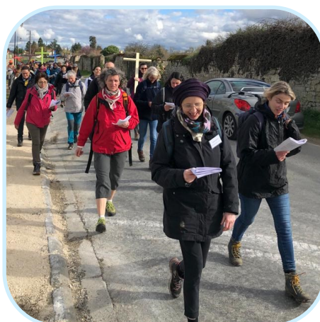
Pèlerinage diocésain des mères de famille de Charente les 6 & 7 avril 2024