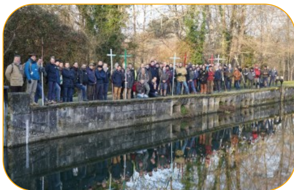
Pèlerinage diocésain des pères de famille de Charente les 16 & 17 mars 2024

Organisé par les chanoines de Saint Astier (24) et Montbron-La Rochefoucauld(16) Dépliant et inscriptions sur le site internet et au fond des églises