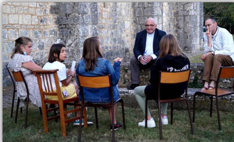
Entretien avec les confirmands samedi soir à La Rochette