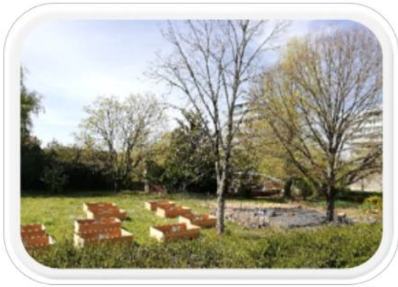
Jardin Participatif de la maison diocésaine soutenu par le Forum Magdalena

Cette association répond également à la volonté de l'évêque, Monseigneur Gosselin, d'ouvrir les portes de la maison diocésaine, bijou architectural en plein centre-ville d'Angoulême, au public charentais, grâce aux appels à projets lancés aux équipes d'animation pastorale des 5 doyennés.