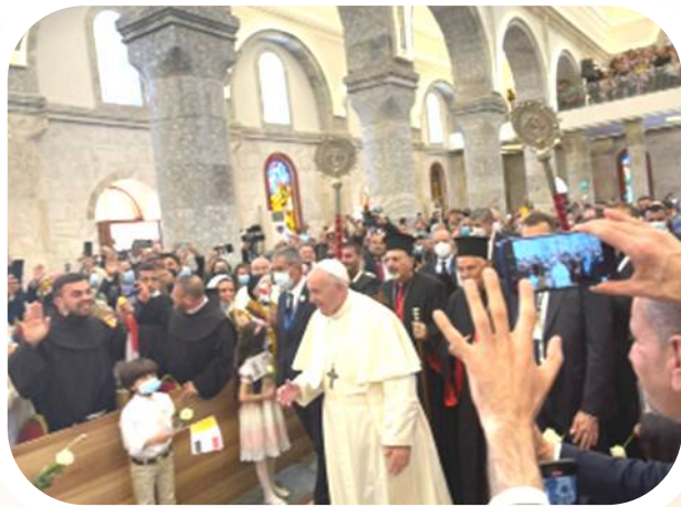
Qaraqosh, dans la nef de la cathédrale Al-Tahira

Du 5 au 7 mars 2021, le Pape François s'est rendu en Irak. Il s'agissait à la fois d'un pèlerinage sur les pas d'Abraham et d'autres personnages bibliques, et d'un voyage pastoral pour rencontrer et encourager les chrétiens d'Irak.