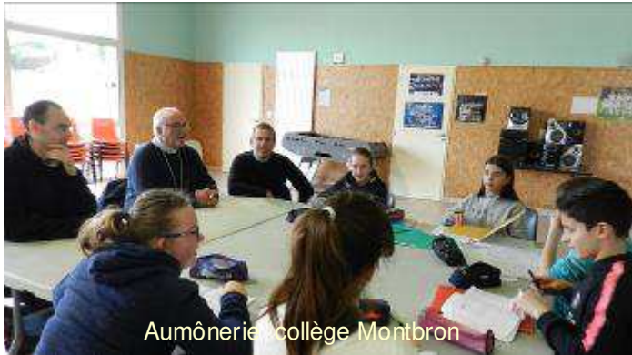
Aumônerie collège Montbron