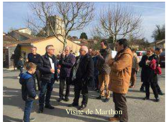
Visite de Marthon