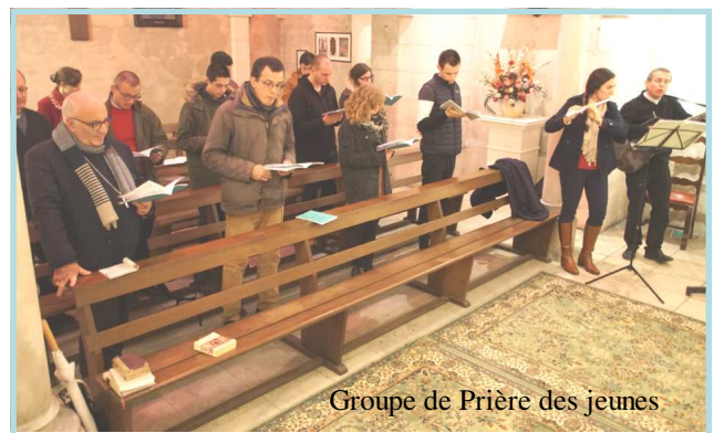
Groupe de Prière des jeunes