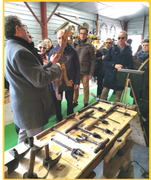
Musée des vieux outils