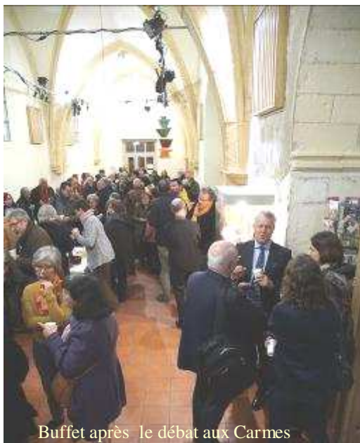
Buffet après le débat aux Carmes