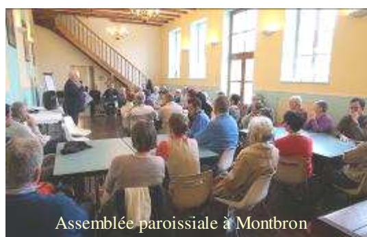
Assemblée paroissiale à Montbron

Au revoir Monseigneur, Revenez quand il vous plaira !