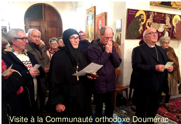
Visite à la Communauté orthodoxe Doumérac