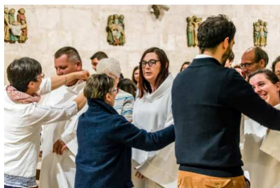
Photo prise lors de l'appel décisif des catéchumènes à Jarnac, en présence de l'évêque et des membres de l'équipe paroissiale du catéchuménat.