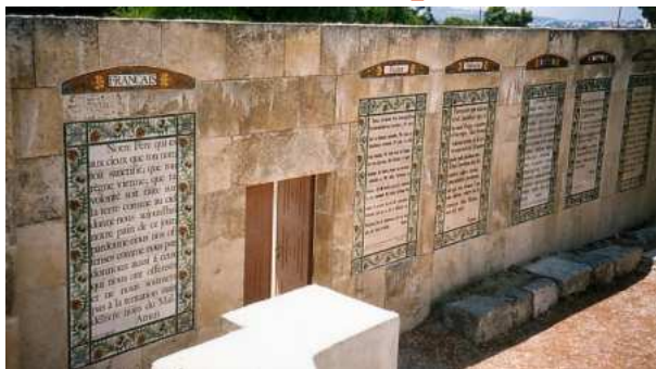
Le cloître du 'Notre Père', sur le Monts des oliviers à Jérusalem